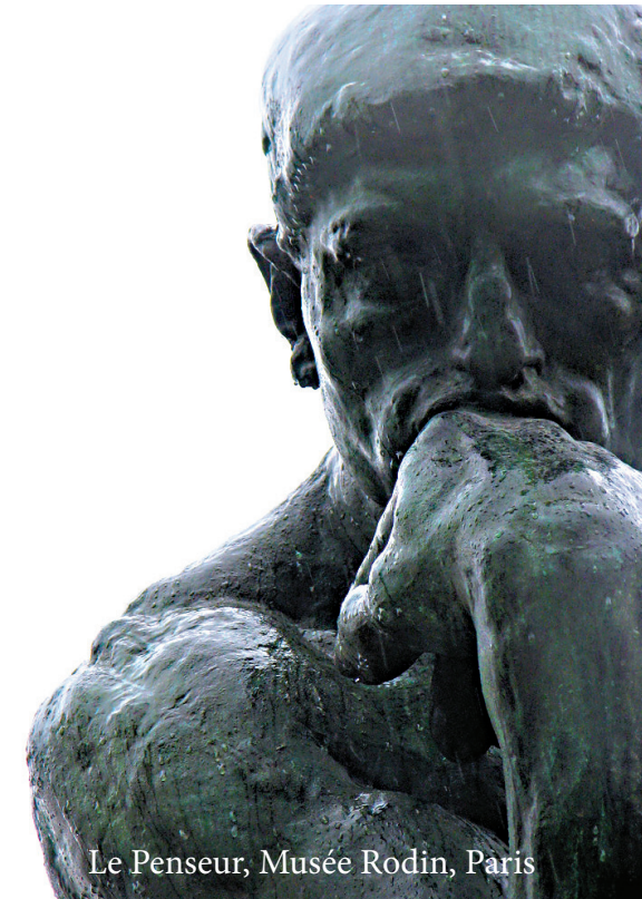
Le Penseur, Musée Rodin, Paris